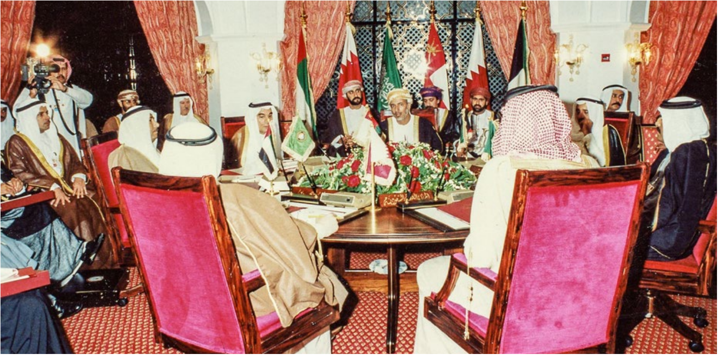
وزراء خارجية دول مجلس التعاون الخليجي يجتمعون على هامش القمة الـ 10 لدول مجلس التعاون الخليجي في مسقط ، سلطنة عمان. تصوير : الدكتور جون دوك أنثوني، 1989.