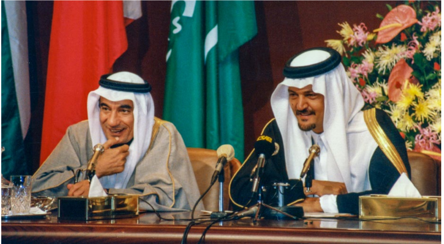
من اليسار سعادة السفير عبد الله بشارة ومن اليمين صاحب السمو الملكي الأمير سعود الفيصل ، وزير الشؤون الخارجية للمملكة العربية السعودية طويل الخدمة ( 1975 إلى 2015 ) في قمة الرياض الـ 8 لمجلس التعاون الخليجي . تصوير: الدكتور جون دوك أنثوني، 1987.

• إنشاء وإدارة مجلس دول التعاون الخليجي من البداية لمطارات الست دول جميعها أقرت بطاقة الهوية على مستوى دول مجلس التعاون الخليجي لكل مواطن، إلى جانب إمتيازات سفر مميزة بين الدول الأعضاء. وهذا يسمح لمواطني دول مجلس التعاون الخليجي خاصتاً بالانتقال من مكان إلى آخر بسهولة، ويمكّنهم ، حيثما أمكن من التعامل مع إجراءات مراقبة الجوازات والعمليات الجمركية والإلتزامات الأخرى المطلوبة من مواطني دول مجلس التعاون الخليجي إلى حد كبير. هذه الحرية في التنقل للمواطنين الخليجين مع مرور الوقت كانت لصالح الإقتصادات الإقليمية.